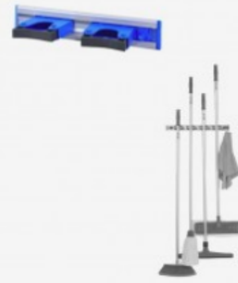
მოპების საკიდი 2ც