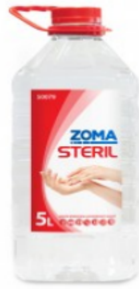
Zoma Steril (PET)

4.46 ლ იატაკისა და ინტერიერის ყოველდღიური სანმენდი საშუალება შეკვების მინ. რაოდ: 1 შეკვების მაქს. რაოდ: 20 ID: 4860121740553