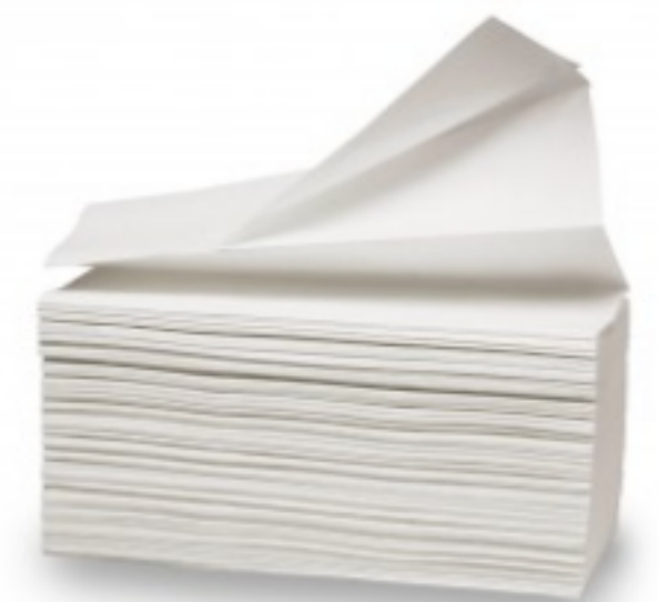
Z ტიპის ქაღალდის ხელსახოცი