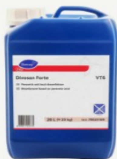
Divosan Forte VT6