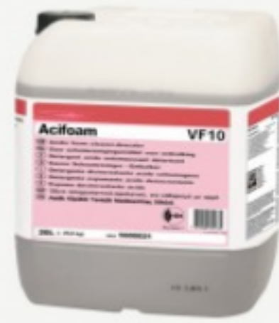
AciFoam VF10 20L