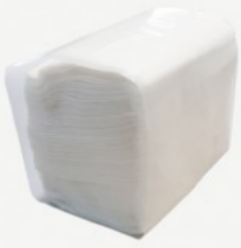
მაგიდის დისპენსერის ხელსახოცი