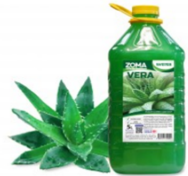
Zoma Vera (PET)

116.86 ლ ძლიერმოქმედი სარეცხი საშუალება 20ლ შეკვების მინ. რაოდ: 1 შეკვების მაქს. რაოდ: 4 ID: EN2029