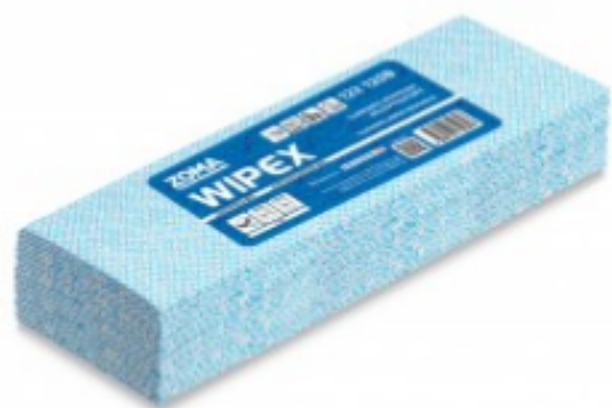
WIPEX Super Strong 4C Extended Use Wipes