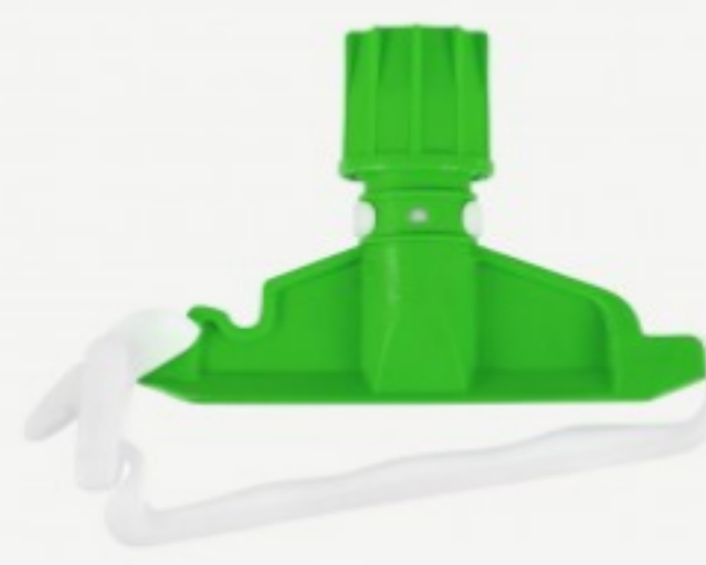
იატაკის ტილოს დამჭერი

შეკვეთის მინ. რაოდ: 1 შეკვეთის მაქს. რაოდ: 10 ID: AP375K