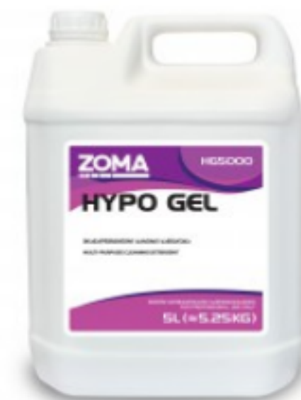
Zoma Hypo GEL

2.53 ლ 21*21სმ; 200 ცალი; ორფენიანი შეკვების მინ. რაოდ: 15 შეკვების მაქს. რაოდ: 150 ID: Z6031