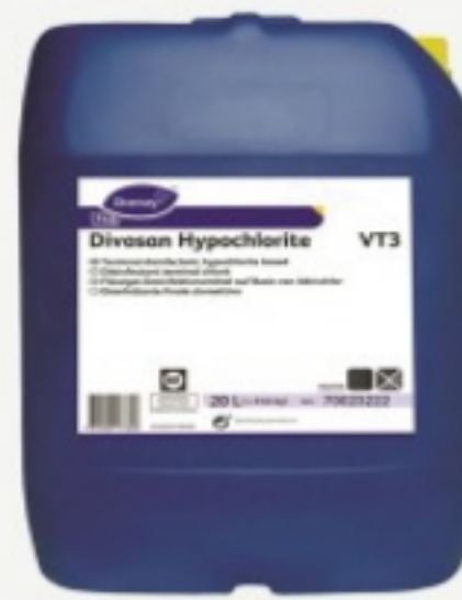
Diversey Divosan Hypochlorite VT3