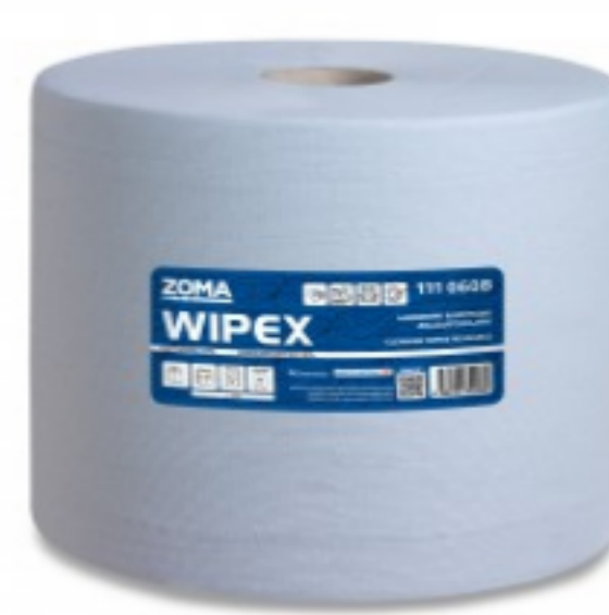
WIPEX 60 Light Blue Extended Use Wipes