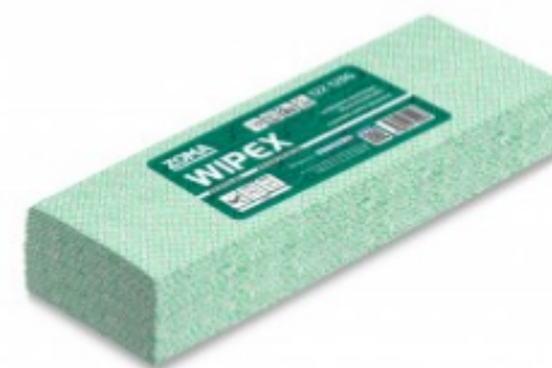
WIPEX Super Strong 4C Extended Use Wipes