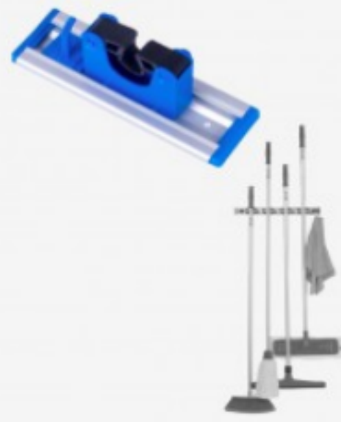
მოპების საკიდი 1ც