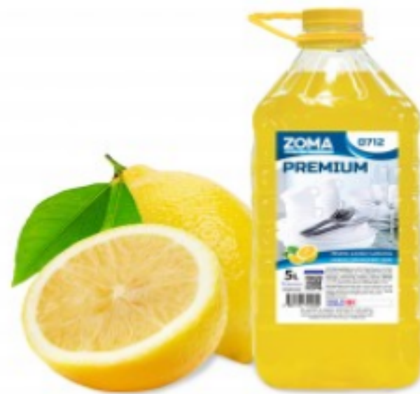
Zoma Premium ლიმონი