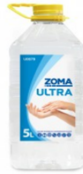
Zoma Ultra (PET)

70.73 ლ სწრაფი უნივერსალური სადებიინფექციო საშუალება 5ლ შეკვების მინ. რაოდ: 1 შეკვების მაქს. რაოდ: 50 ID: zomas0079