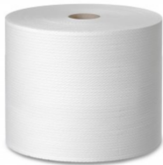
WIPEX 110 Super Strong Blue Extended Use Wipes