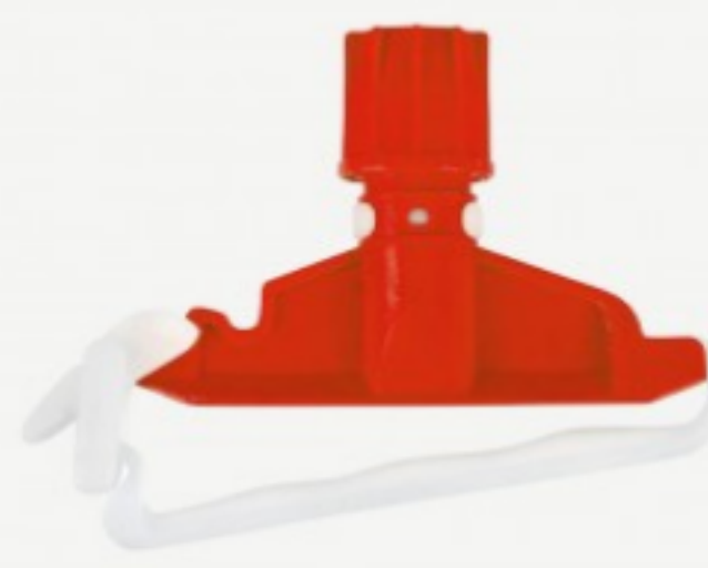
იატაკის ტილოს დამჭერი

შეკვეთის მინ. რაოდ: 1 შეკვეთის მაქს. რაოდ: 4 ID: 7514243