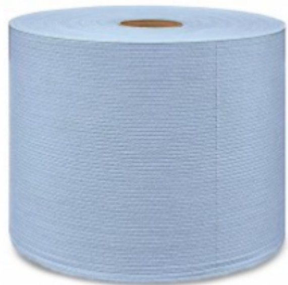
WIPEX 110 Super Strong Blue Extended Use Wipes