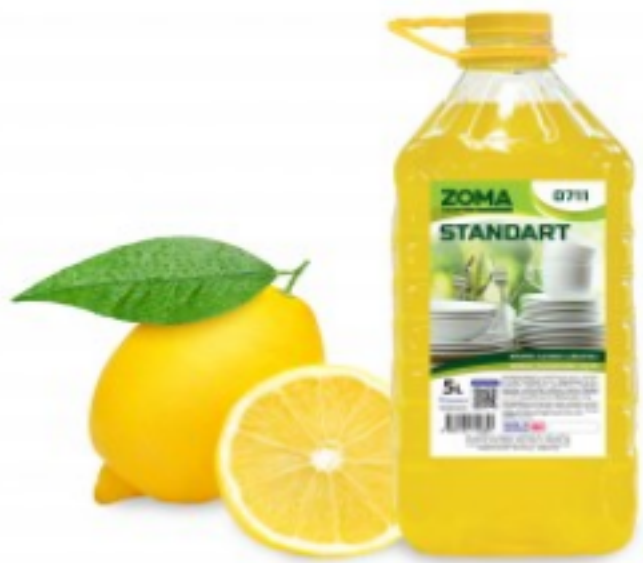
Zoma Standart ლიმონი (PET)