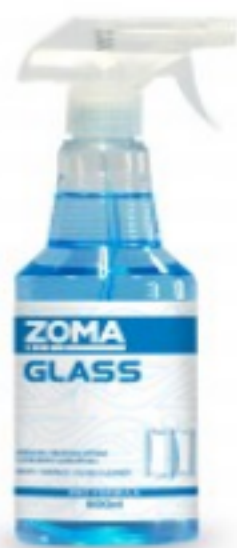
Zoma Glass სპრეით

32.8 ლ მრავალფუნქციური სარეცხი საშუალება 5ლ შეკვების მინ. რაოდ: 1 შეკვების მაქს. რაოდ: 10 ID: 4860121740690