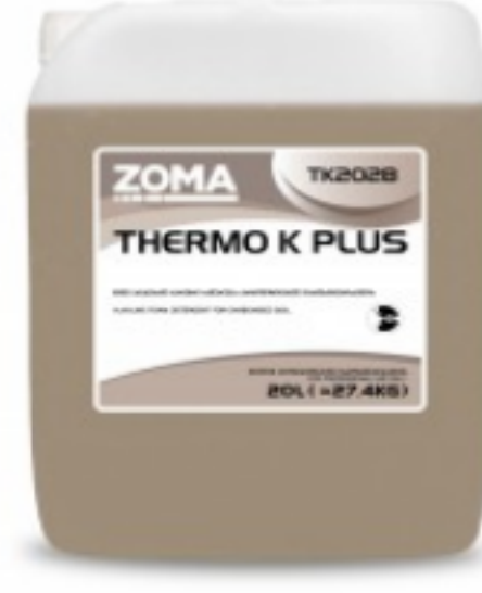
Thermo K Plus