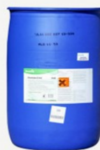
Dicolube D64 VL8