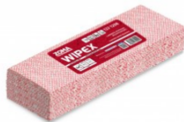
WIPEX Super Strong 4C Extended Use Wipes