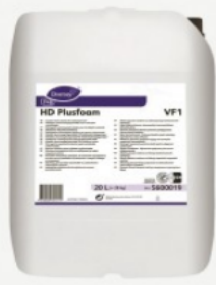
HD Plusfoam VF1

შეკვეთის მინ. რაოდ: 1 შეკვეთის მაქს. რაოდ: 4 ID: 5600013