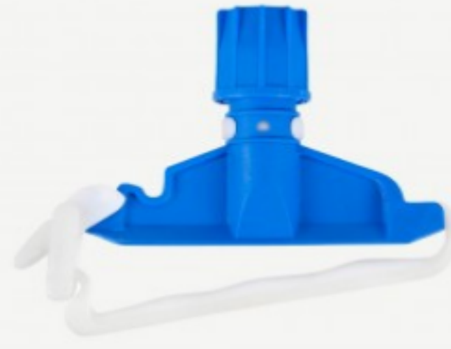
იატაკის ტილოს დამჭერი