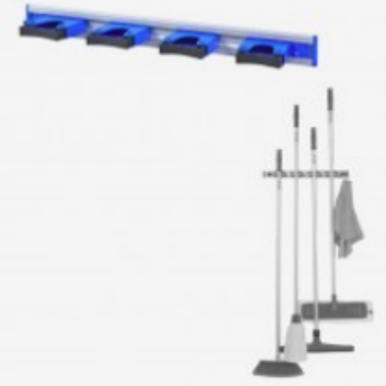
მოპების საკიდი 4ც