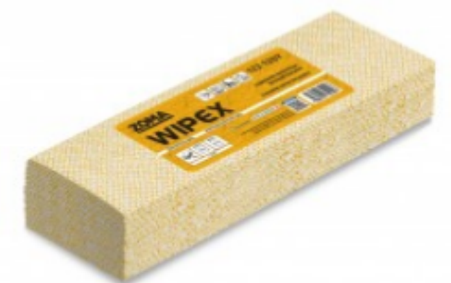
WIPEX Super Strong 4C Extended Use Wipes