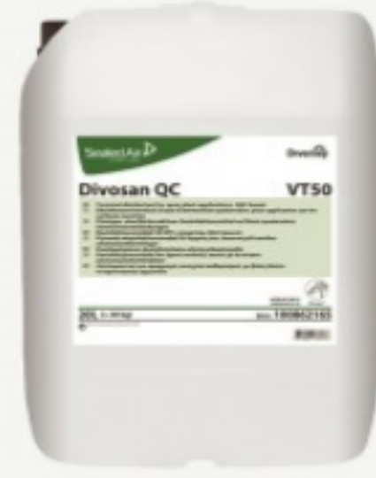
Diversey Divosan QC VT50

შეკვეთის მინ. რაოდ: 1 შეკვეთის მაქს. რაოდ: 4 ID: 7509261