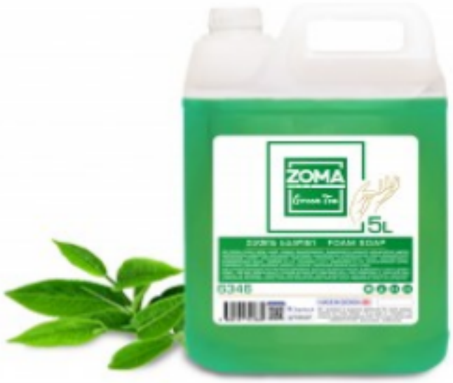
Zoma Green Tea