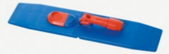
პლასტმასის ტილოს დამჭერი