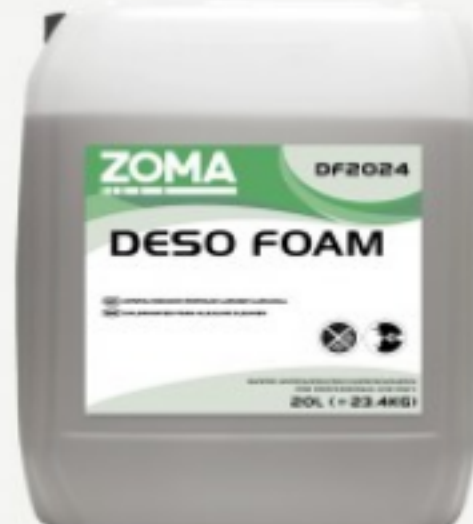
Zoma DESO FOAM

272.6 ლ Diversey შვავა სარეცხი საშუალება 20ლ შეკვების მინ. რაოდ: 1 შეკვების მაქს. რაოდ: 10 ID: 101100776