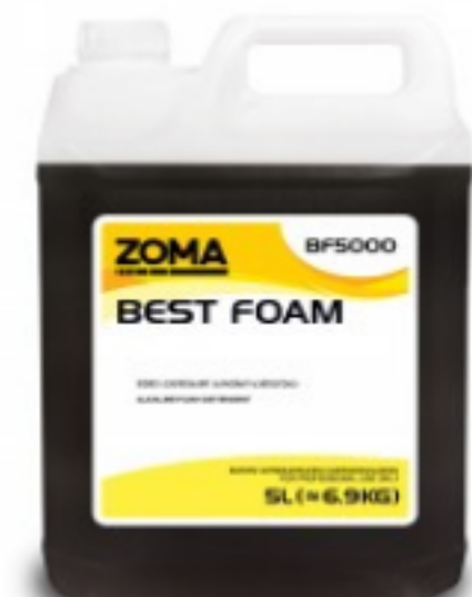
Zoma Best Foam

150.03 ლ კონცენტრირებული სარეცხი საშუალება დებიინფექციის ფუნქციით შეკვების მინ. რაოდ: 1 შეკვების მაქს. რაოდ: 10 ID: QF2021