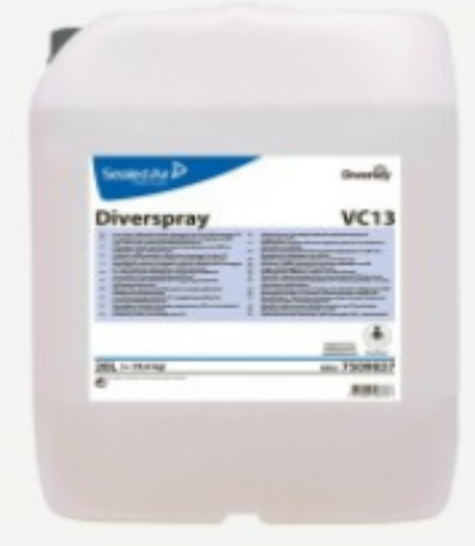
Diversey Diverspray VC13