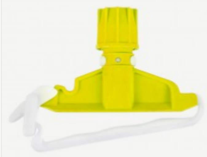
იატაკის ტილოს დამჭერი

შეკვეთის მინ. რაოდ: 1 შეკვეთის მაქს. რაოდ: 10 ID: AP375Y