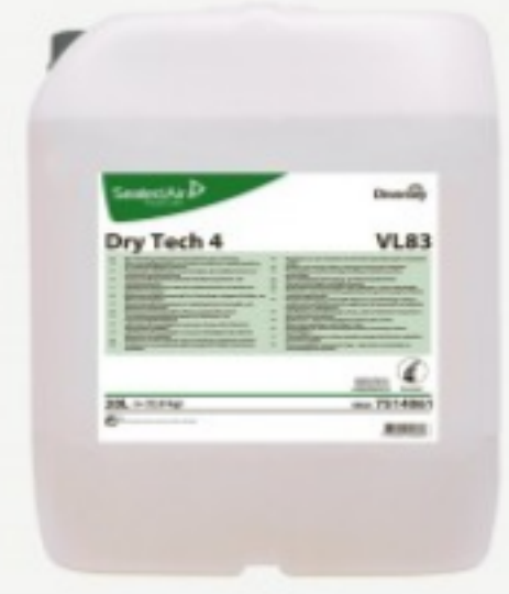
Dry Tech 4 VL83

შეკვეთის მინ. რაოდ: 1 შეკვეთის მაქს. რაოდ: 4 ID: 7510596