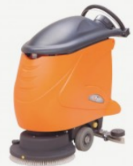
TASKI Swingo 755 BMS Eco