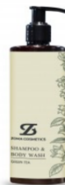
Zoma Cosmetics, Shampoo & Body Wash, Green Tea