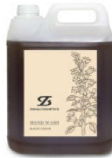
Zoma Cosmetics, Hand Wash, Black Cedar