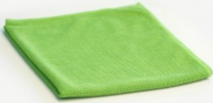
მიკროფიბრის ტილო მიკროჯეტ