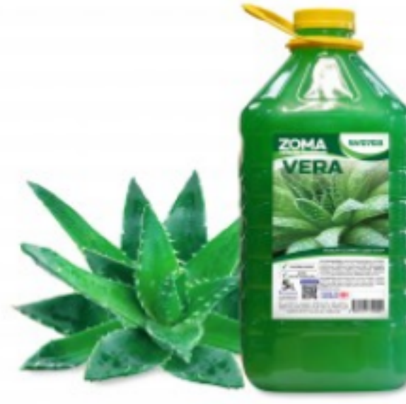
Zoma Vera (PET)