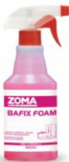
Zoma Bafix Foam