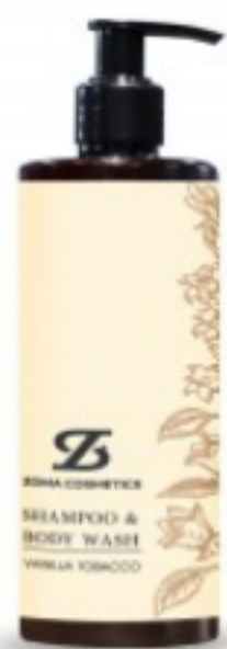
ZOMA COSMETICS, SHAMPOO & BODY WASH, VANILLA TOBACCO