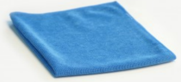
მიკროფიბრის ტილო მიკროჯეტ