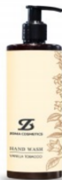
ZOMA COSMETICS, HAND WASH, VANILLA TOBACCO