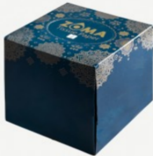
რბილი ხელსახოცი ყუთში

4.8 ლ ხვია; სიგრძე - 80მ; სიგანე - 18სმ; ორფენიანი; პერფორირებული. შეკვეთის მინ. რაოდ: 6 შეკვეთის მაქს. რაოდ: 60 ID: L1201