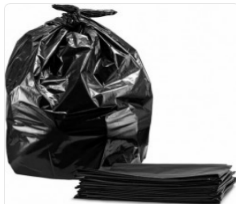
ნაგვის ტომარა 55*60

0 ლ შეკვეთის მინ. რაოდ: 1 შეკვეთის მაქს. რაოდ: 4 ID: M14AB