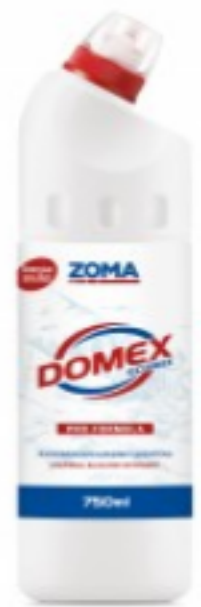
Zoma Domex Ecomix