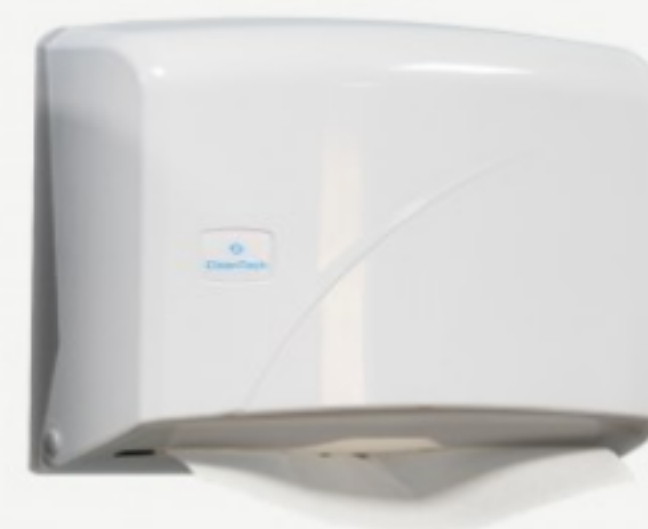
Z- ტიპის ხელსახოცის დისპენსერი

2.83 ლ 21*20სმ; 100გ; ორფენიანი შეკვეთის მინ. რაოდ: 21 შეკვეთის მაქს. რაოდ: 210 ID: 4860121740461