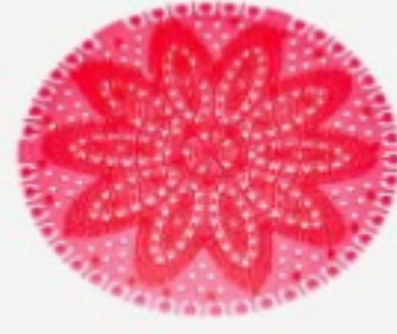
Solare Koku Giderici Tropikal