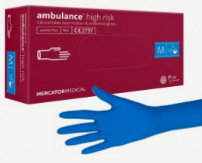
Ambulance High Risk