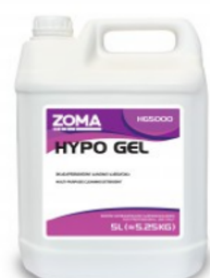
Zoma Hypo GEL