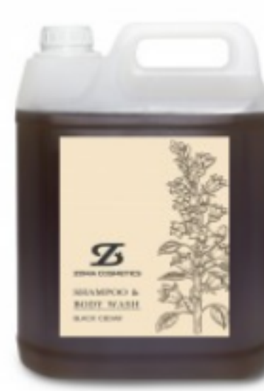
Zoma Cosmetics, Shampoo & Body Wash, Black Cedar