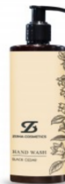
ZOMA COSMETICS, HAND WASH, BLACK CEDAR