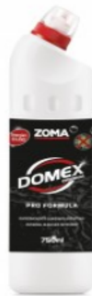
Zoma Domex Original