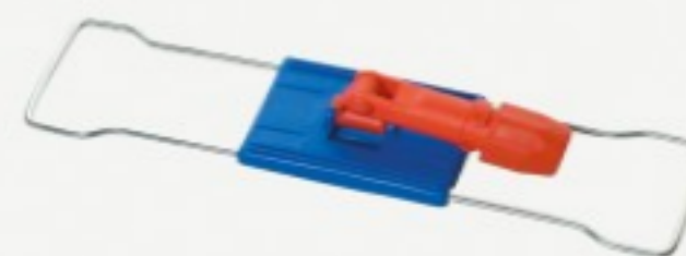
რკინის ტილოს დამჭერი

948.55 ლ Mediclinics ხელის სენსორული საშრობი შავი შეკვეთის მინ. რაოდ: 1 შეკვეთის მაქს. რაოდ: 4 ID: M09AB