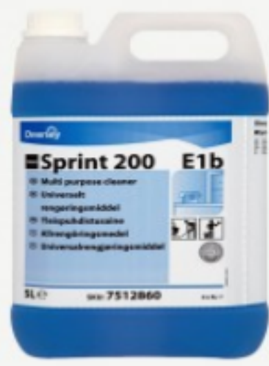
TASKI Sprint 200 E1b