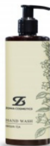
ZOMA COSMETICS, HAND WASH, GREEN TEA