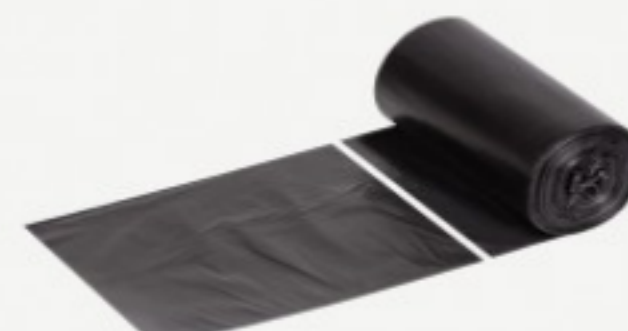
ნაგვის ტომარა 72*95

0.07 ლ ნაგვის ტომარა 20გ 8 მიკრონი შეკვეთის მინ. რაოდ: 20 შეკვეთის მაქს. რაოდ: 2000 ID: 00515/1