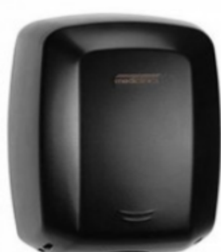
MACHFLOW HAND DRYER, BLACK

813.04 ლ Mediclinics ხელის სენსორული საშრობი თეთრი შეკვეთის მინ. რაოდ: 1 შეკვეთის მაქს. რაოდ: 10 ID: M09A