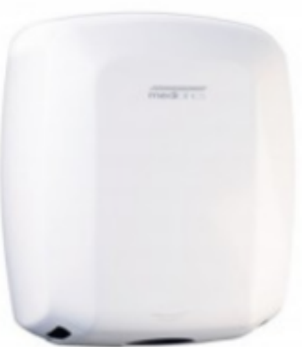
MACHFLOW HAND DRYER, WHITE

25.05 ლ Vialli თეთრი შეკვეთის მინ. რაოდ: 1 შეკვეთის მაქს. რაოდ: 20 ID: K.1