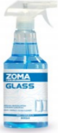
Zoma Glass სპრეით