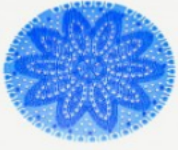
Solare Koku Giderici Tutti Frutti