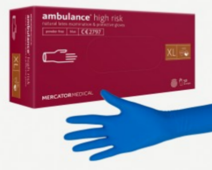
Ambulance High Risk