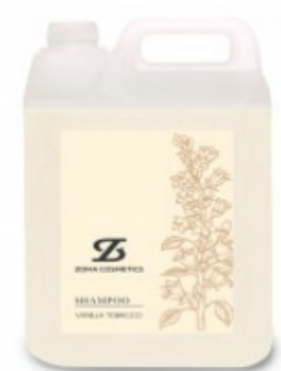
ZOMA COSMETICS, SHAMPOO, VANILLA TOBACCO