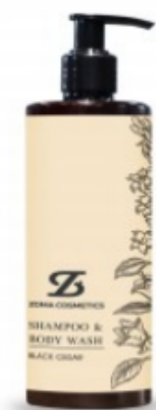
ZOMA COSMETICS, SHAMPOO & BODY WASH, BLACK CEDAR