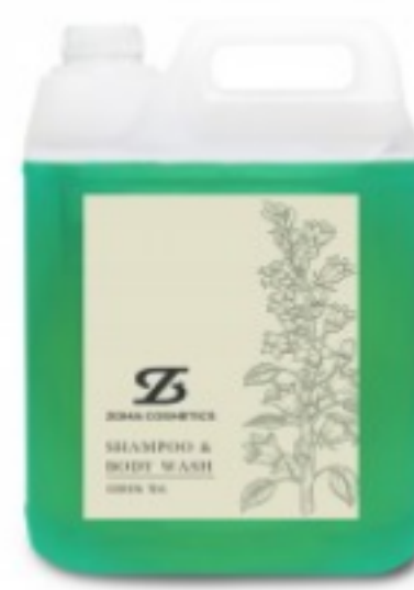
Zoma Cosmetics, Shampoo & Body Wash, Green Tea