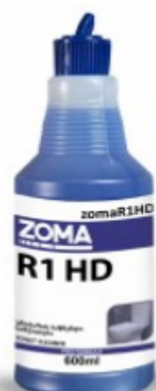
Zoma R1 HD