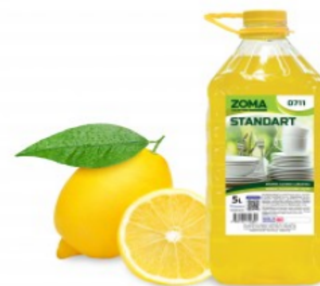
Zoma Standart ლიმონი (PET)

0.39 ლ ნაგვის ტომარა შავი 10გ შეკვეთის მინ. რაოდ: 10 შეკვეთის მაქს. რაოდ: 200 ID: 00017/1