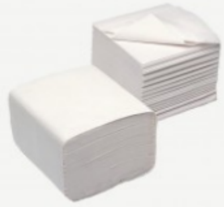
დაკეცილი ტუალეტის ქაღალდი