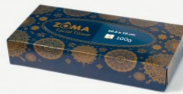
რბილი ხელსახოცი ყუთში

3.01 ლ 21*20სმ; 80გ; ორფენიანი შეკვეთის მინ. რაოდ: 18 შეკვეთის მაქს. რაოდ: 180 ID: 4860121740454