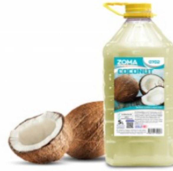
Zoma Coconut 5L (PET)