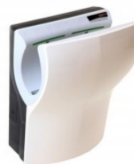
DUALFLOWPLUS HAND DRYER, WHITE

9.49 ლ Ermop შოპის ნაწილი შეკვეთის მინ. რაოდ: 1 შეკვეთის მაქს. რაოდ: 20 ID: APT50