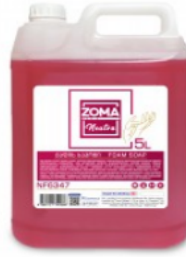
Zoma Neutra Foam Soap