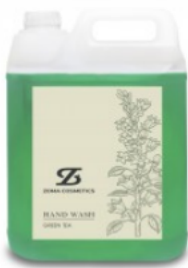
Zoma Cosmetics, Hand Wash, Green Tea