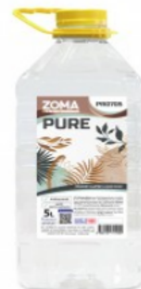
Zoma Pure (PET)