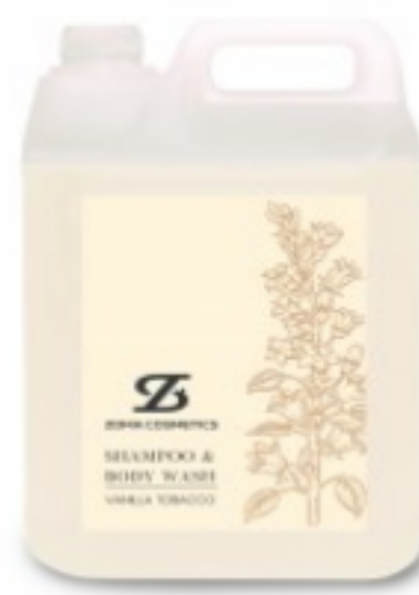
Zoma Cosmetics, Shampoo & Body Wash, Vanilla Tobacco