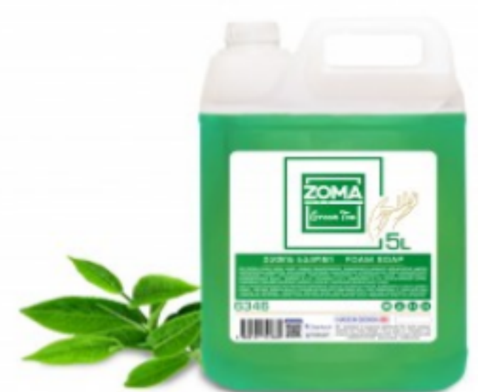
Zoma Green Tea