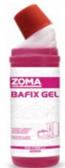
Zoma Bafix Gel