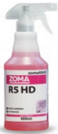
Zoma R5 HD