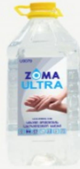
Zoma Ultra (PET)