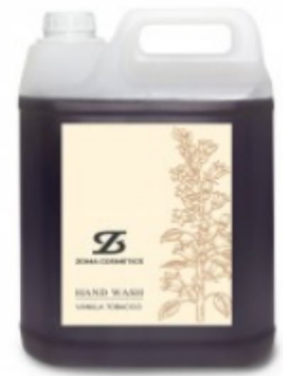
Zoma Cosmetics, Hand Wash, Vanilla Tobacco