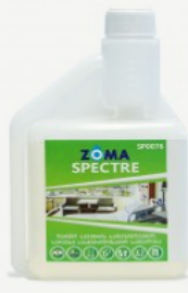
Zoma Spectre კონცენტრატი