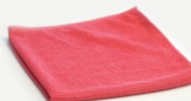
მიკროფიბრის ტილო მიკროჭეტ

8.01 ლ ხვია; სიგრძე- 130მ; სიგანე- 20,7სმ; ორფენიანი; პერფორირებული შეკვეთის მინ. რაოდ: 6 შეკვეთის მაქს. რაოდ: 60 ID: L1041