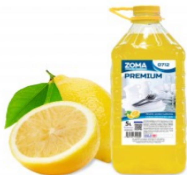
Zoma Premium ლიმონი

13.89 ლ ჭურჭლის სარეცხი საშუალება (ფელე) 5ლ შეკვეთის მინ. რაოდ: 1 შეკვეთის მაქს. რაოდ: 10 ID: 4860121740621