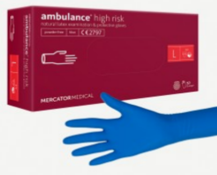
Ambulance High Risk