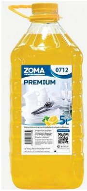
Zoma Premium 0712